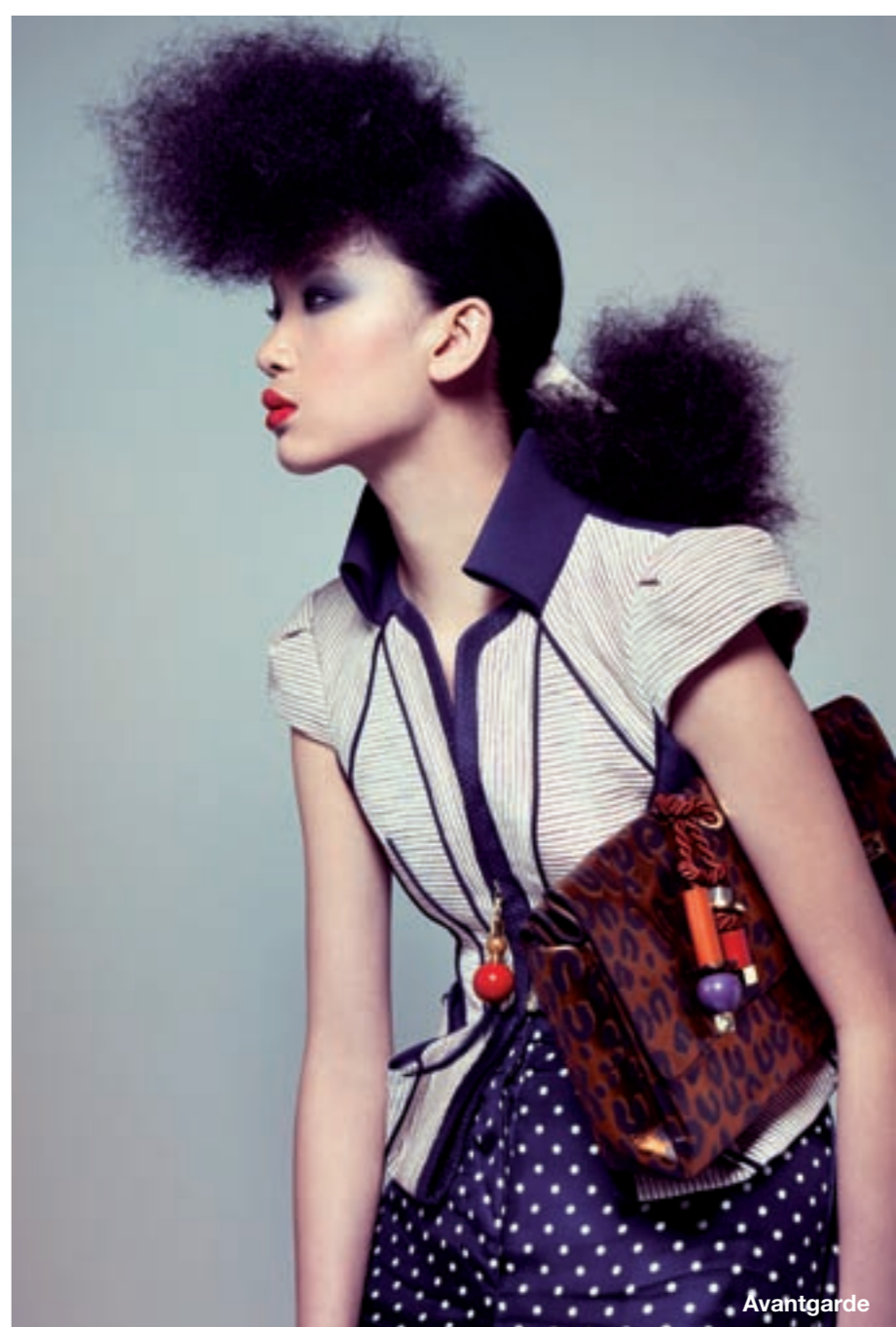
Avantgarde fotografie Petrovsky & Ramona

‘Mogeen Hairschool is dé opleiding voor aankomende hairstylisten, sessionstylisten en visagisten die hun talent willen ontwikkelen en de stap naar de top van de mode-industrie willen maken.’