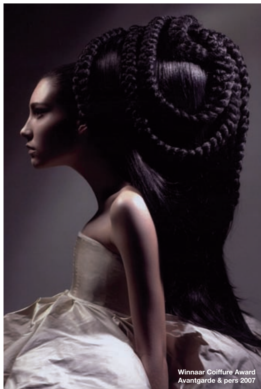
Winnaar Coiffure Award Avantgarde & pers 2007 fotografie Altard Horvath

‘Fashion is Rock 'n Roll op het hoogste niveau.’