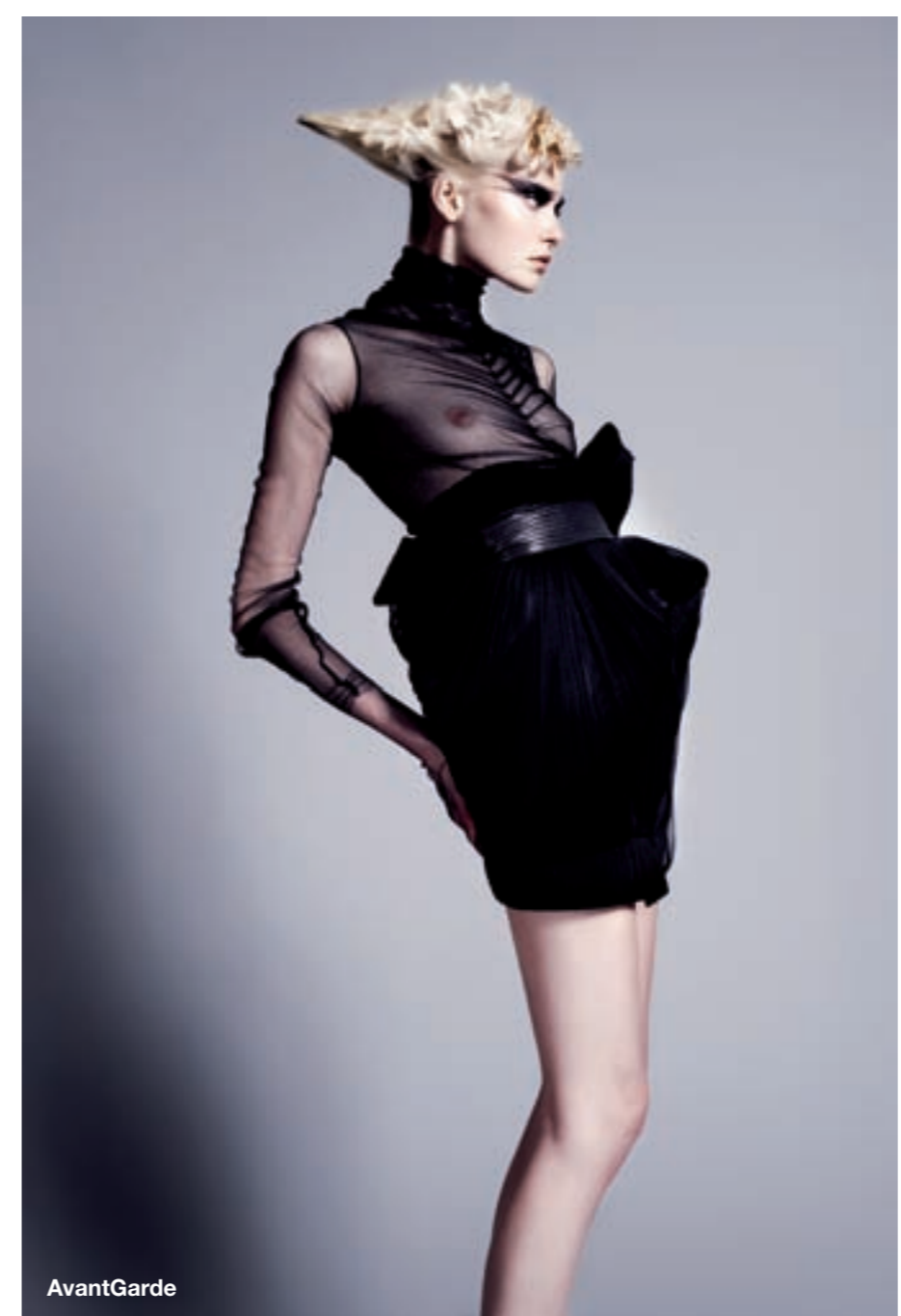
AvantGarde Make up Perrel Kuusma

‘Je leert denken in concepten en mogelijkheden.’